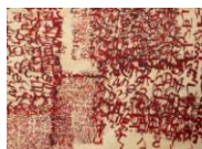
Lámina de zinc grabado al aguafuerte y pintura 16,5x30cm.